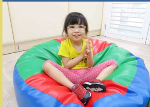
妞妞和媽媽一起參與親子團體課程情形