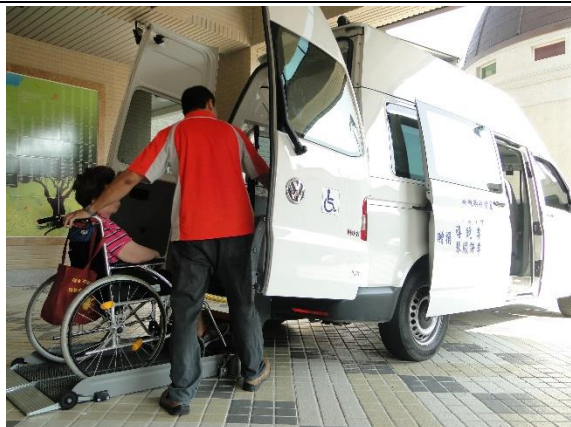
定期交通接送就醫。