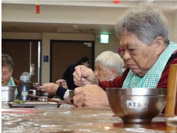
鼓勵長輩自行用餐，以維持其自理能力。