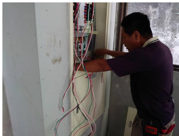
小規模多機能籌設修繕工程-水電工程 2