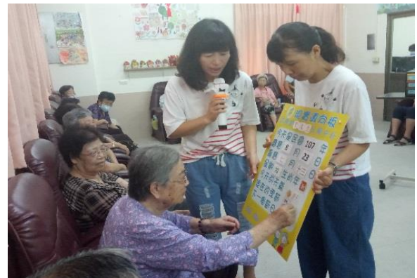
每日透過現實導向減緩失智長輩老化速度。