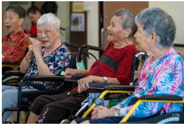
藉由聚會、活動，將長輩常聚在一起話家常。