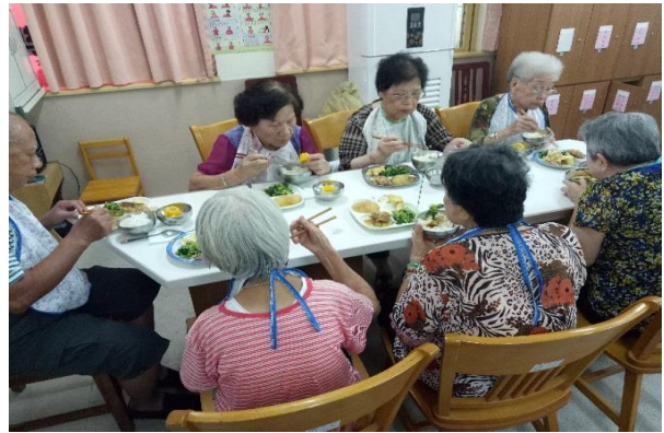
營養均衡的午餐及下午點心。