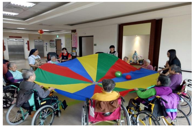
從趣味遊戲中達到復健功能。