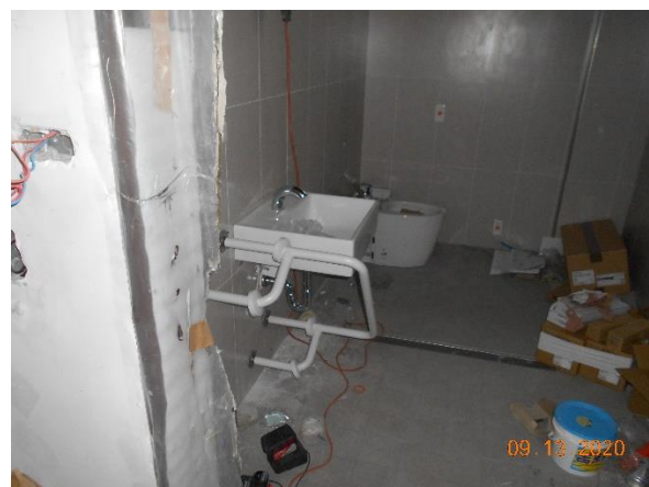
小規模多機能籌設修繕工程-水電工程 4