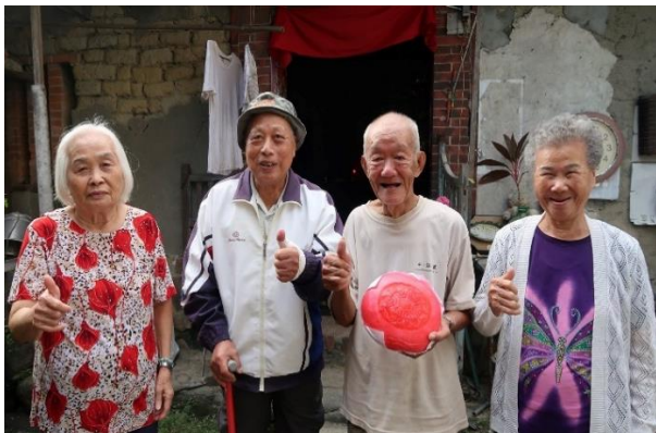
為了避免節慶來臨時，獨居長輩思親情緒，會安排長輩訪視彼此關懷，讓社區成為「一家人」。