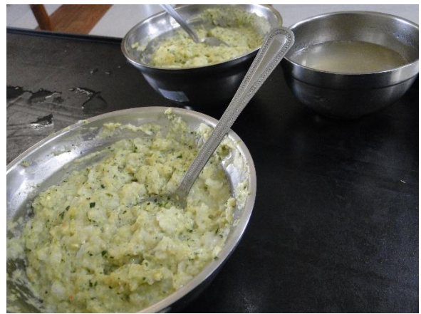
依不同咀嚼能力準備不同的調理方式。