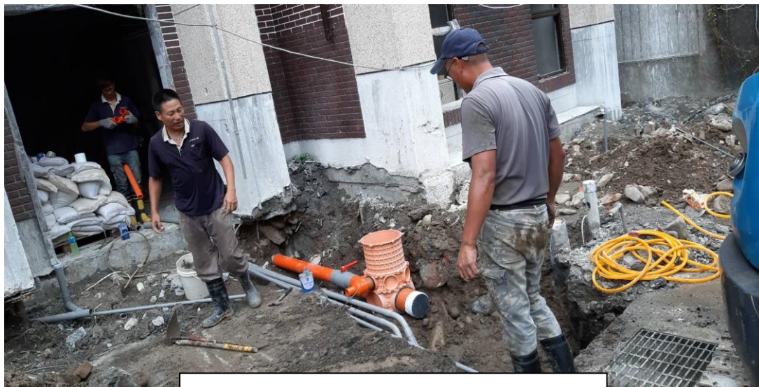
小規模多機能籌設修繕工程-污水處理