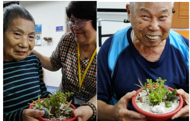
園藝課程幫助長輩找到生命力！