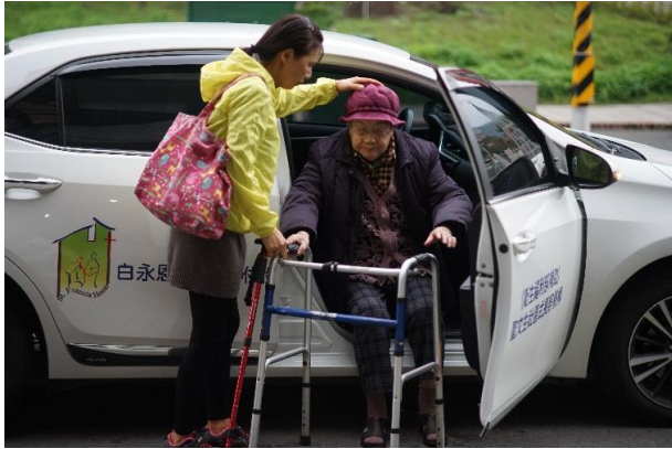
愛，從走出家門開始。用心的日照服務。