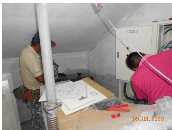
小規模多機能籌設修繕工程-水電工程 3