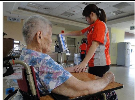
不能少的日常健康維護。