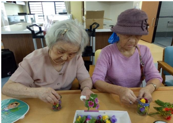
部份失智長者缺乏腦部運用與思考，藉由園藝輔療刺激其認知功能，提升腦部活化。