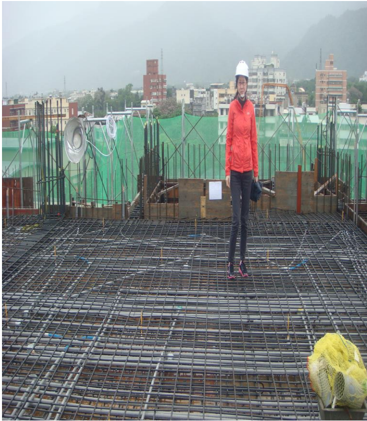
◎ 5F 柱. 牆配管、頂版灌漿、6F 柱. 牆配管

本案勸募財務所得$ 21,624,101 元全數作為宜蘭聖方濟老人長期照顧中心重建經費，支付第 13-19 期興建工程款及第 9-15 期電機工程款，重建工程在 104 年 6 月 2 日舉行上樑儀式，8 月 20 日完成頂樓造型的灌漿之後，主體結構工程已暫告段落，緊接著是外牆磁磚、水電工程以及室內裝修正在趕工中。宜蘭聖方濟老人長期照顧中心，規劃新建八層樓 40 床現代化多功能無障礙服務環境，以提供當地弱勢長者長期照顧的需求。重建工程民國 103 年 5 月 1 日正式展開後，各項工程均依計劃如期進行，感謝天主的祝福，以及董事長谷聲野神父、執行長費克強神父、蔡恩忠神父、劉訓評顧問、沈宗樺建築師、袁芳中先生等重建小組成員的殷勤督責，讓工程平安順利，施工會議已進行達 30 次以上，都是為了確保施工品質無虞，並使未來各空間、設施設備都能夠發揮最專業的效益，讓聖方濟安老院成為在地愛的堡壘。